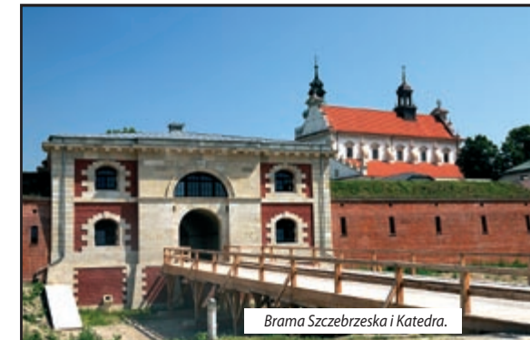
Brama Szczebrzeska i Katedra.