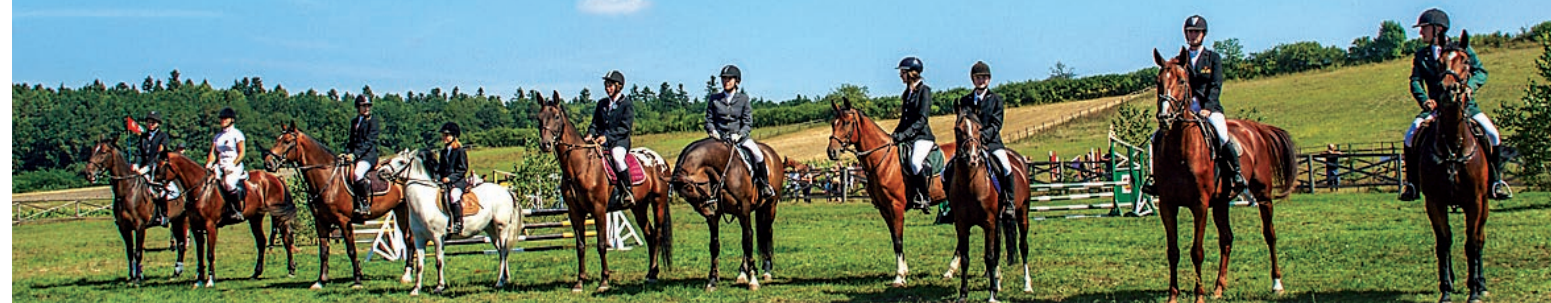
Stadnina koni „Tarka”.