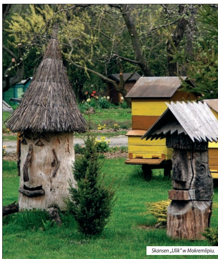
Skansen „Ulik” w Mokrelipiu.