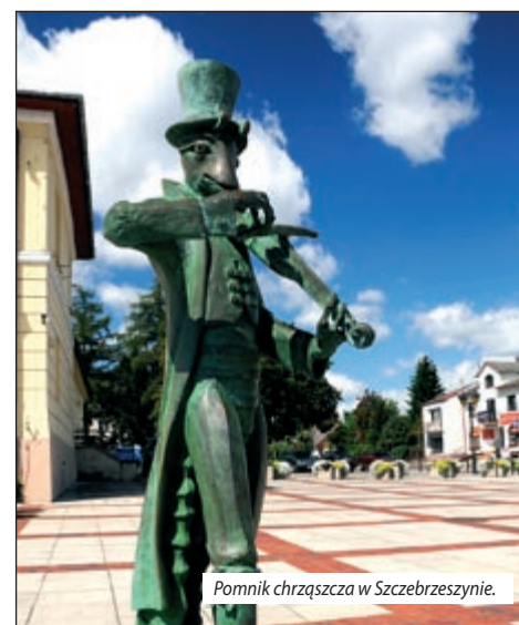
Pomnik chrząszcza w Szczebrzeszynie.

Lokalna Organizacja Turystyczna „Zamość i Roztocze”