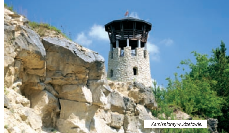
Kamieniomy w Józefowie.

Miłośników historii zainteresują średniowieczne grodziska i ślady Powstania Styczniowego, którego 150. rocznicę właśnie obchodzimy. Można je spotkać m.in. w Krasnobrodzie, Józefowie Zwierzyncu, Panasówce i Batorzu. Wiele jest też pamiątek po obu wojnach światowych: okopy i cmentarze z I wojny oraz pomniki na polach bitew stoczonych w kampanii wrześniowej i przez partyzantów w czasie II wojny (w tym największej w Polsce pod Osuchami). Są też przypomi-