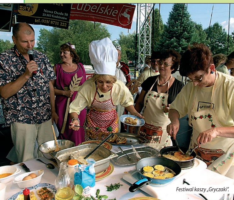
Festiwal kaszy „Gryczaki”.

Na janowskich „ Gryczakach ” można dostać zawrotu głowy od bogactwa dań z kaszy , nie tylko z gryczanej. Natomiast podczas Festiwalu Produktu Lokalnego , odbywającego się w ramach Jarmarku Hetmańskiego w Zamościu, częstują wszystkim, co może się znaleźć na stole, w tym wspaniałymi domowymi winami i nalewkami .