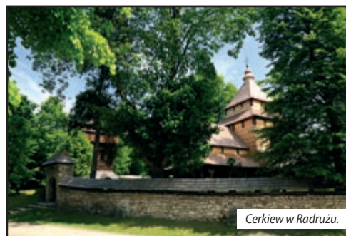
Cerkiew w Radrużu.