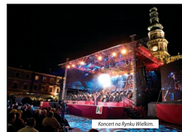
Koncert na Rynku Wielkim.