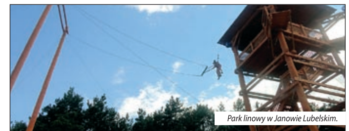
Park linowy w Janowie Lubelskim.

Na Roztoczu jest kilka parków linowych. Dużą popularności cieszy się park nad zalewem w Krasnobrodzie, składający się z 11 umiarkowanie trudnych przeszkód. Ale prawdziwą próbą charakteru jest wizyta w parku nad zalewem w Janowie Lubelskim z 200-metrowym zjazdem linowym nad plażą i zalewem, diabelskim wahadłem – skokiem tandemowym lub pojedynczym z wysokości 16 m – i Power Fanem – pionowym skokiem w dół z wysokości 13 m, z progresywnym hamowaniem. Ale mają tam też mniej hardcorowe propozycje.