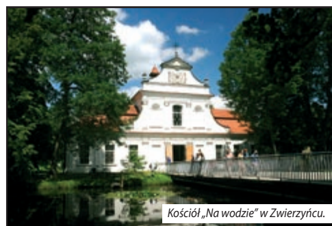
Kościół „Na wodzie” w Zwierzyńcu.