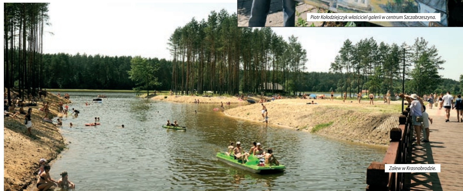
Zalew w Krasnobrodzie.