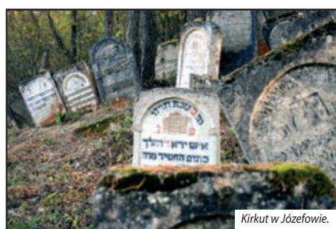
Kirkut w Józefowie.