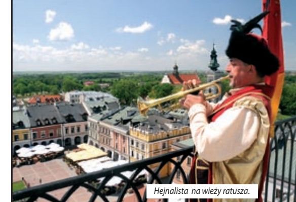
Hejnalista na wieży ratusza.