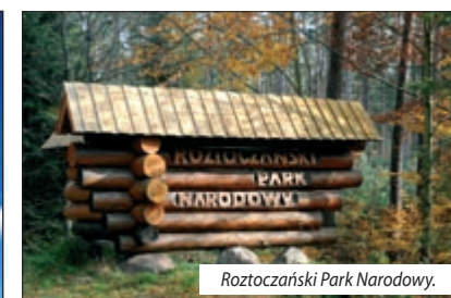
Roztoczański Park Narodowy.