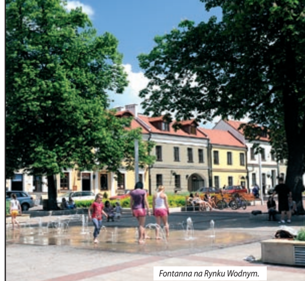
Fontanna na Rynku Wodnym.